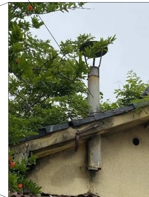
石綿含有建材(煙突石綿管)